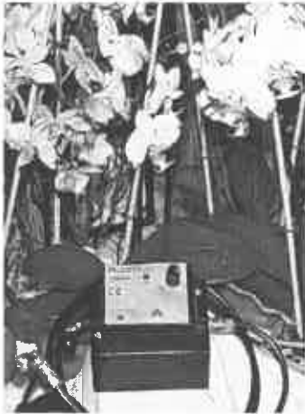
NEU – "tropic" und "exotic" !